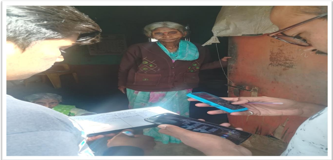
NSS Volunteers conducting door to door survey at Mouje Sangaon